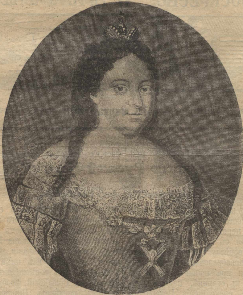
Императрица Анна Іоанновна.

ства Императрица Анна Іоанновна избѣгала войны съ сосѣдними державами. Вслѣдствіе этого она уступила Персіи завоеванныя Петромъ Великимъ земли на южномъ берегу Каспійскаго моря, требовавшія большихъ расходовъ отъ казны на содержаніе войска и не приносившіе Россіи никакой пользы. Но она должна была вмѣшаться въ дѣла Польши, гдѣ, послѣ смерти короля Августа II, возоблаго вліяніе французовъ въ ущербъ выгодамъ Россіи и враждебная ей партія выбрала въ короли извѣстнаго приверженца Карла XII, Станислава Лещинскаго. Русскія войска вошли въ Польшу, подъ предводительствомъ Миниха, взяли городъ Данцигъ, гдѣ укрылся Стани-